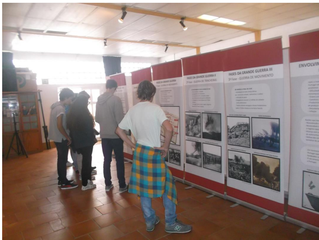
2. - Alunos informam-se sobre o novo armamento de guerra.