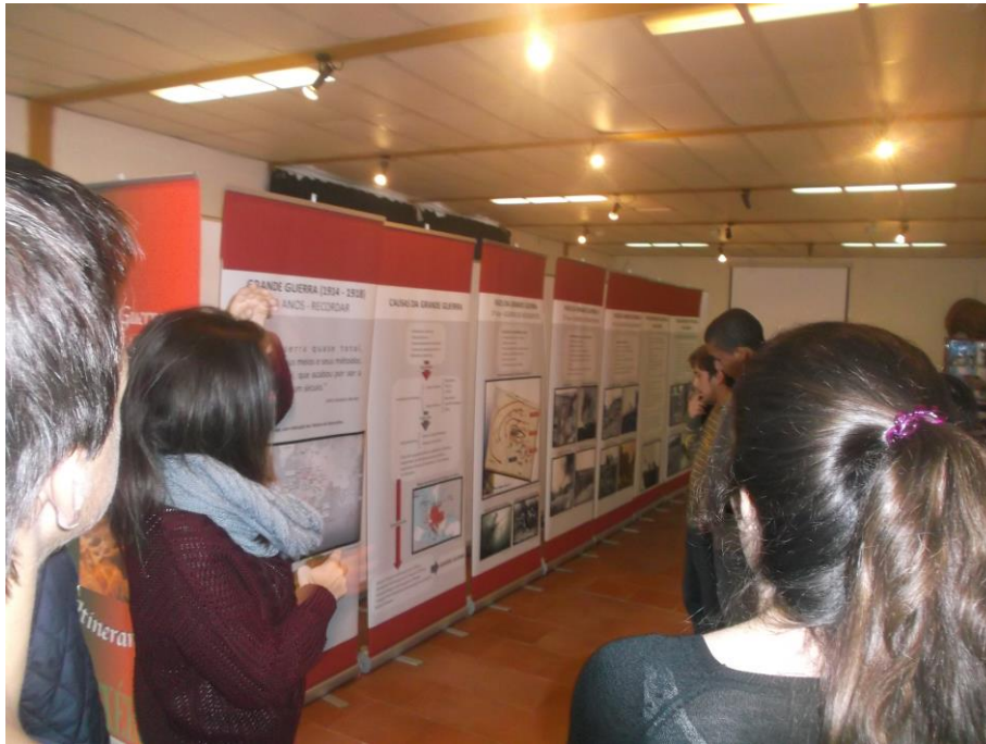
3. - Alunos informam-se sobre as alianças militares - Tríplice Aliança e Tríplice Entente