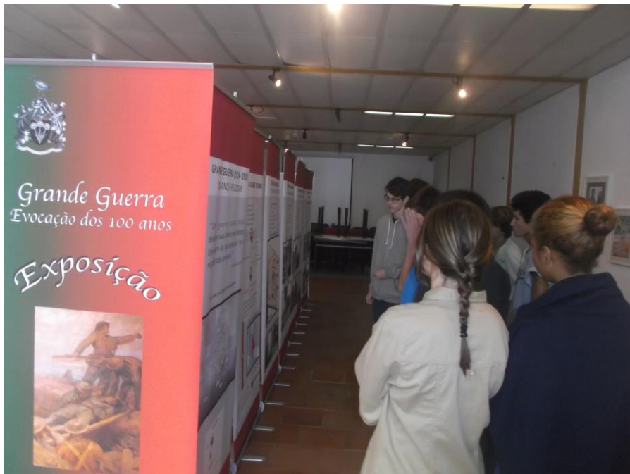
1. – Turma de História e Cultura das Artes visita exposição com o professor.