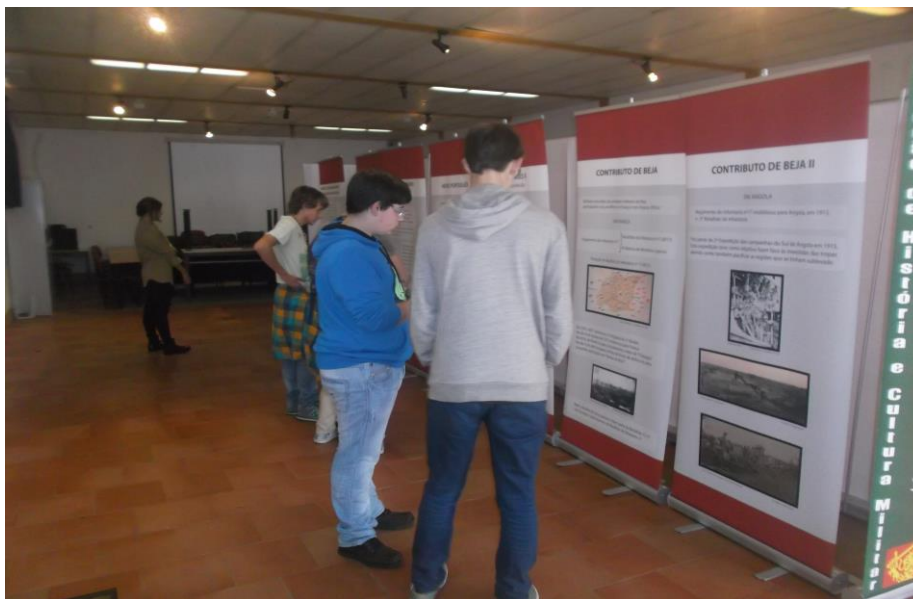
4. – Alunos informam-se acerca do “Soldado Desconhecido”.