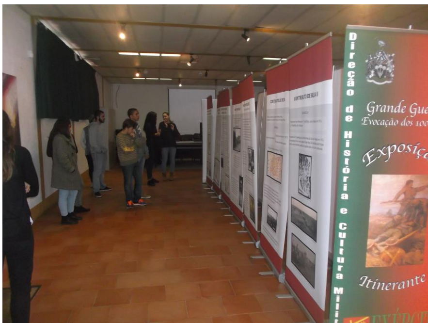
4. – Alunos informam-se acerca do Corpo Expedicionário Português (CEP) e da Batalha de La Lys